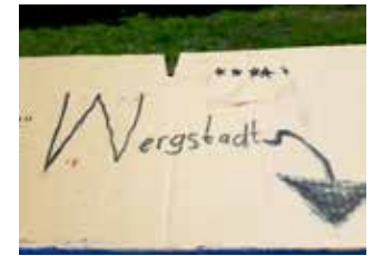
2018 werkelten die Kinder im Spielmobil an ihrer kunterbunten Kinderstadt.