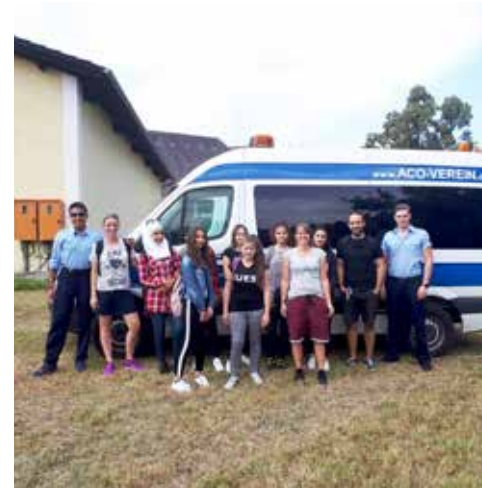
Heimaterkundung in Kooperation mit JuZ in Scherneck