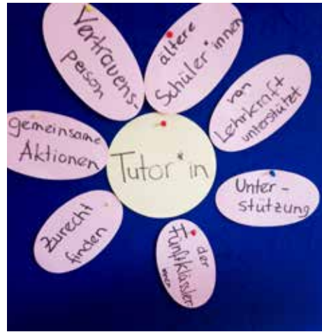
Neu im Angebot des KJR: Training für Tutoren

Zwei Schulungen fanden vor Ort an der Schule statt. Vier Gruppen übernachteten in unserem Jugendhaus. Wer eine Kindergruppe aus der fünften Klasse in der Anfangszeit an der neuen Schule betreut und begleitet, trägt Verantwortung. Die Tätigkeit als Tutor verbindet Jugendarbeit und Schule.