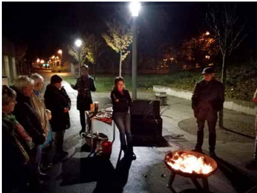
Schamanisches Jahreszeiten- wechsel-Ritual

Schließlich fanden 2018 noch drei vegane Stammtische für Jung und Alt statt. Jugendliche und Erwachsene konnten sich dort bei leckerem Essen über natur- und umweltrelevante Themen austauschen.