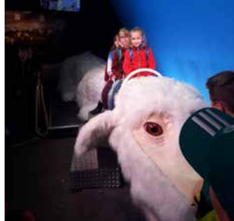
Ausflug in die Bavaria Filmstudios

Das Jugendhaus ist meist zweimal die Woche geöffnet. Kochaktionen und Filmabende gehören zu den Angeboten, wie auch spontane Spiel- und Sportangebote in der benachbarten Sporthalle.