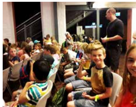
Beim bayerischen Kinder- und Jugendfilmfestival in Roth

Im Jahr 2018 gab es wieder viele Aktionen in den Schulferien, die seit diesem Jahr über die Homepage der Lechfelder Jugendarbeit ( www.junges-lechfeld.de ) angeboten werden.