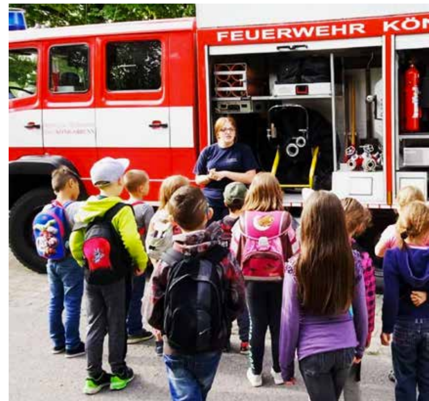
Verschiedene Vereine gestalteten „Schule Vereinigt!“ an der Christophorus-Schule Königsbrunn.

Schulen und Verbände mit den jeweilig vorhandenen Ressourcen vertraut machen. Insgesamt 12 örtliche Vereine und Organisationen präsentierten sich mit Infoständen, Mitmach-Aktionen und Workshops den Kindern und Jugendlichen, auch der KJR war mit seinen Projekten dabei. So lernten die Schüler vielfältige Möglichkeiten für ihre Freizeitgestaltung kennen. Viele Vereinsmitglieder hatten sich den Vormittag Tag extra freigenommen. An dieser Stelle ein großes Dankeschön an alle Beteiligten!