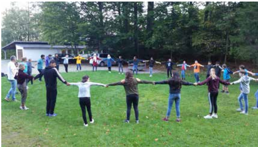
together mit 7aM