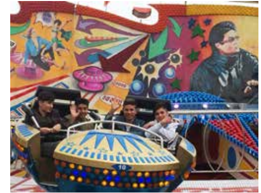
Besuch des Plärrers zum Kennenlernen bayerischer Bräuche wie einem Volksfest