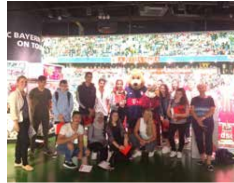
Allianz Arena zur Eröffnung der WM 2018