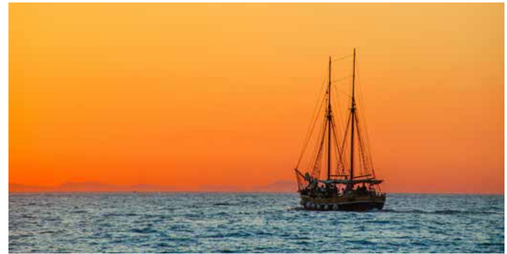
Abendstimmung auf dem Segeltörn, eine Jugendfreizeit in Kooperation mit dem KJR Unterallgäu.

Dank einer Spende der Stiftung Kinderlächchen konnten in diesem Jahr erneut Kinder aus finanziell schlechter gestellten Familien am Ferienprogramm teilnehmen. Durch eine neu geschaffenen Kooperation mit dem Bayerischen Roten Kreuz und zusätzliche personelle Ressourcen konnten in diesem Jahr zwei Kinder mit besonderen Bedürfnissen sowohl im Sommer als auch Herbst im Ferienprogramm teilnehmen und