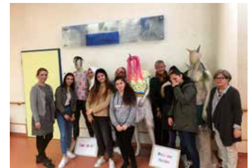
Betriebsbesichtigung Fritz Felsenstein Haus: Im Mittelpunkt steht das Kennenlernen verschiedener sozialer Berufe und der Abbau von Hemmungen gegenüber körperlich und mehrfach behinderten Menschen