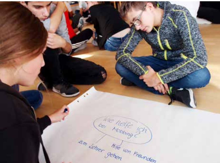
Umgang mit Mobbing ist eines der Themen beim SMV-Seminar.

nung besprochen und zahlreiche Spiele ausprobiert. Während des gemeinsamen Workshops wuchsen die angehenden Tutoren als Team zusammen.